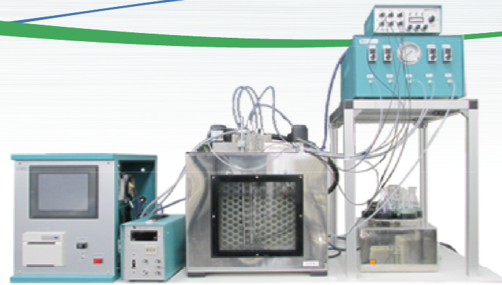
粘度管はウペローゼ改良型（専用特注品）。

高分子化学分野では種々の液体粘度測定が行われています。本装置は、その粘度測定（ガラス製毛細管式粘度計使用）において、粘度管の測定球へのサンプル液供給から、動粘度測定並びにその測定結果出力までの一連の操作が簡単で自動的に行える自動粘度測定装置です。